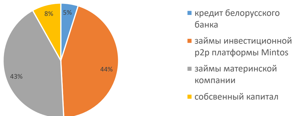
Структура фондирования лизингового портфеля